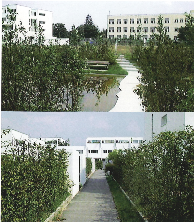
Oben: Weg über Wassersenke · Unten: 2 m hohe Buchenhecken