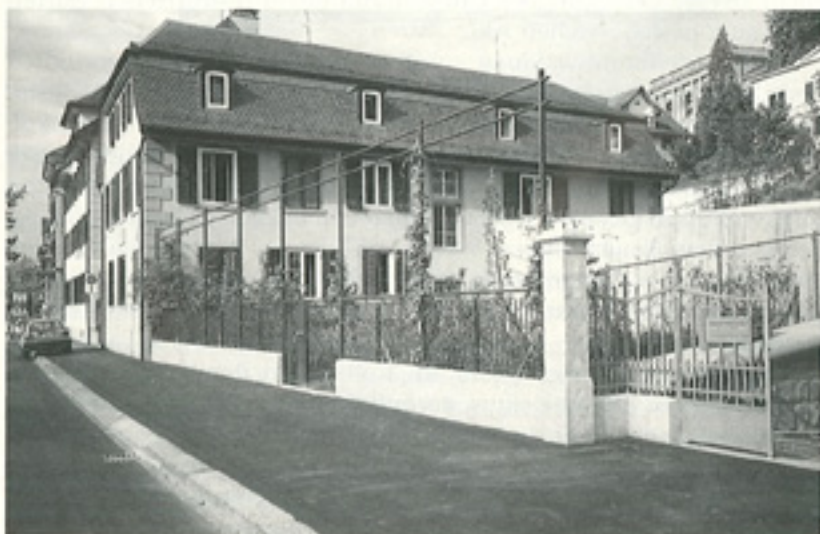
5 Ansicht vom Hirschengraben, 1992. Der an der Strasse vorherrschende Gartenabschluss von Zaun mit fensterbildendem Rankgerüst auf Natursteinsockel ist mit den vorhandenen alten Sockeln und Pflösten und neuem Gitterwerk aufgenommen worden.

Für den Zwischenangriffsschacht der S-Bahn wurde der ehemalige terrassierte Pflanzgarten vollständig aufgehoben. Von der kantonalen Denkmalpflege wurde an der städtebaulich empfindlichen Lage eine Rekonstruktion erwartet. Die Wiederherstellung suchte jedoch vielmehr die Essenz der ursprünglichen Anlage, des einfachen, verborgenen Gartens, abgeschlossen gegen aussen, der die historische Situation am Hirschengraben neben dem Geburtshaus von Alfred Escher, der Kirche und unterhalb vom barocken Pavillon des Stockargutes respektiert und auch die Überlagerung der technischen Einbauten gestalterisch aufnimmt.